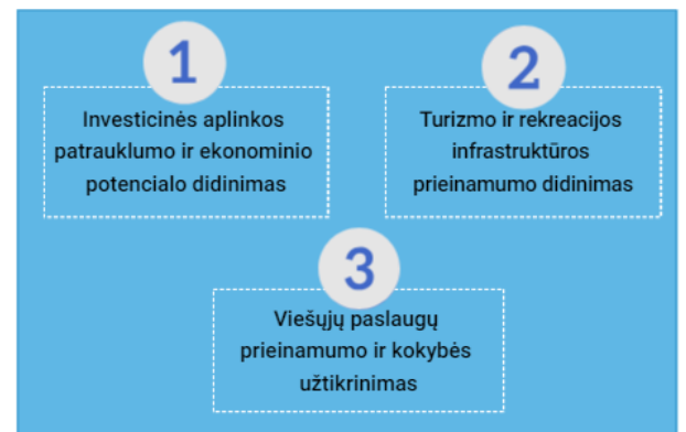
1.7. pav. 2022-2030 m. Utenos regiono plėtros plano prioritetai

Vienas svarbiausių regiono lygmens planavimo dokumentų yra 2022–2030 m. Utenos regiono plėtros planas. Plane identifikuojamos regiono problemos ir jas lemiančios giluminės priežastys, apžvelgiama bendra regiono socialinė, ekonominė situacija, numatomos priemonės situacijos pagerinimui iki 2030 m. Plane identifikuotos prioritetingos sritys: investicinės aplinkos patrauklumo ir ekonominio potencialo didinimas, turizmo ir rekreacijos infrastruktūros prieinamumo didinimas, viešųjų paslaugų prieinamumo ir kokybės užtikrinimas (žr. 1.7. paveikslą).