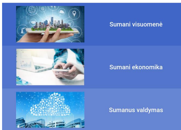
1.4. pav. LPS „Lietuva 2030“ kryptys

Strategijoje išskiriamos pažangai svarbios vertybės – atvirumas, kūrybingumas ir atsakomybė bei 3 pažangos sritys: visuomenė, ekonomika ir valdymas. Siekiami įgyvendinti pokyčiai šiose srityse įtvirtins pažangos vertybes ir remsis darnaus vystymosi principais. Pokyčių tikimasi šiose srityse: 1) sumani visuomenė; 2) sumani ekonomika; 3) sumanus valdymas (žr. 1.4. paveikslą).