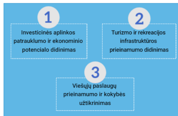
1.7. pav. 2022-2030 m. Utenos regiono plėtros plano prioritetai

Vienas svarbiausių regiono lygmens planavimo dokumentų yra 2022–2030 m. Utenos regiono plėtros planas. Plane identifikuojamos regiono problemos ir jas lemiančios giluminės priežastys, apžvelgiama bendra regiono socialinė, ekonominė situacija, numatomos priemonės situacijos pagerinimui iki 2030 m. Plane identifikuotos prioritetingos sritys: investicinės aplinkos patrauklumo ir ekonominio potencialo didinimas, turizmo ir rekreacijos infrastruktūros prieinamumo didinimas, viešųjų paslaugų prieinamumo ir kokybės užtikrinimas (žr. 1.7. paveikslą).