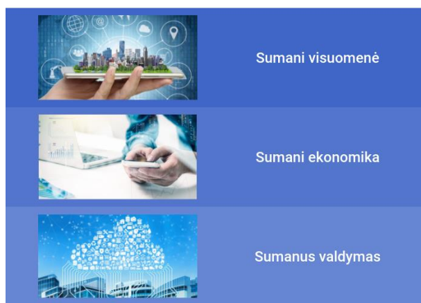
1.4. pav. LPS „Lietuva 2030“ kryptys

Strategijoje išskiriamos pažangai svarbios vertybės – atvirumas, kūrybingumas ir atsakomybė bei 3 pažangos sritys: visuomenė, ekonomika ir valdymas. Siekiami įgyvendinti pokyčiai šiose srityse įtvirtins pažangos vertybes ir remsis darnaus vystymosi principais. Pokyčių tikimasi šiose srityse: 1) sumani visuomenė; 2) sumani ekonomika; 3) sumanus valdymas (žr. 1.4. paveikslą).