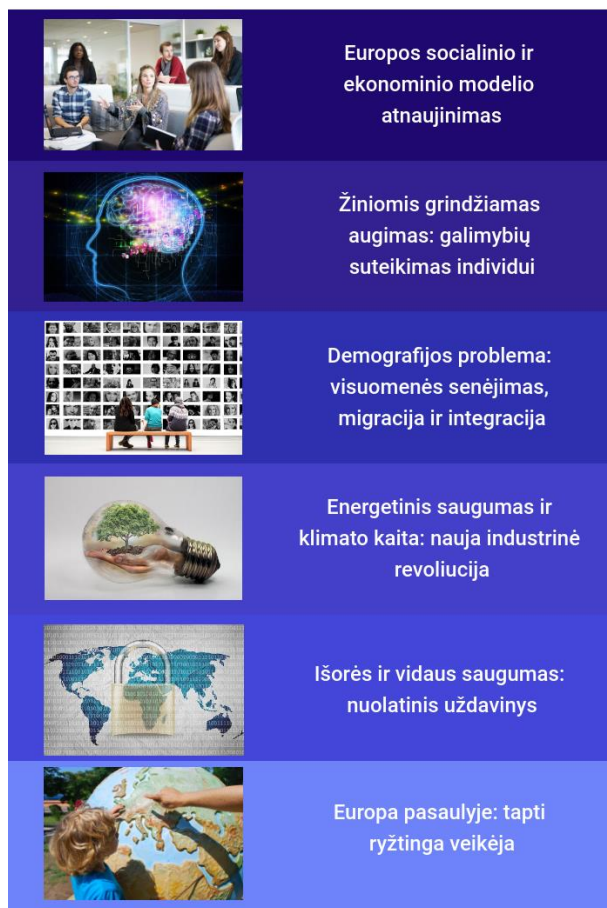
1.2. pav. „Europa 2030“ tikslai

Darnaus ES vystymosi siekiama prisidedant prie projekto „Europa 2030“. Dokumente suformuoti šeši tikslai (žr. 1.2. paveikslą).