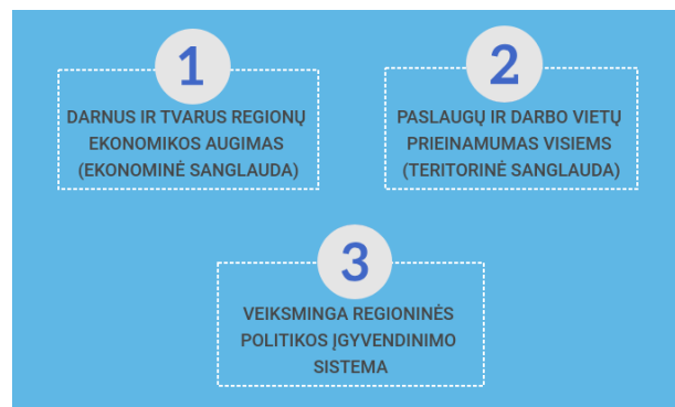
1.6. pav. Nacionalinės regioninės politikos prioritetų iki 2030 metų projektas

dokumentų rengimą ir tvirtinimą, taip pat nacionalinę regioninę politiką įgyvendinančius subjektus ir jų įgaliojimus. Įstatyme nurodomas Nacionalinės regioninės politikos tikslas – skatinti tolygią ir tvarią plėtrą visoje valstybės teritorijoje. Vadovaujantis Įstatymo 12 straipsnio 1 punktu, yra parengti Nacionalinės regioninės politikos prioritetai iki 2030 metų 3 , kuriame suformuoti 3 prioritetai.