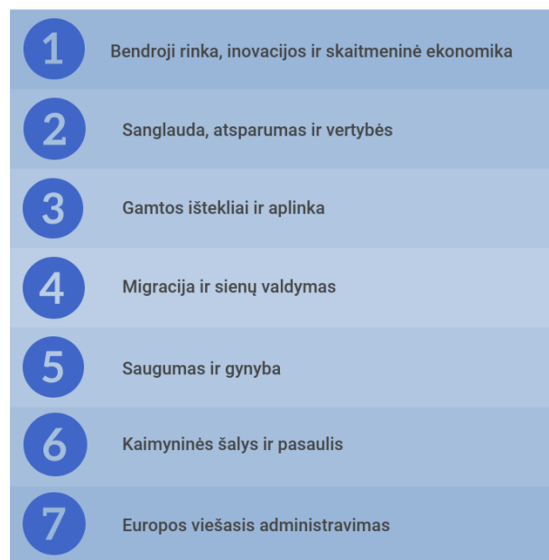
1.3. pav. 2021–2027 metų daugiamečių finansinės programos išlaidų kategorijos

2021–2027 metams DFP struktūra atspindi aiškius politikos prioritetus dėl racialesnio ir skaidresnio biudžeto, kurį sudaro 7 išlaidų kategorijos (žr. 1.3. paveikslą).